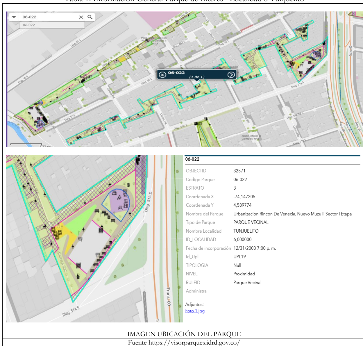
Tabla 1: Información General Parque de Interés– Localidad 6 Tunjuelito